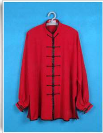
Modèle N°1 "Classique"

- 6 modèles disponibles pour le Haut du kimono pour toutes les matières