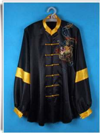
Modèle N°4 "Royal" Dessin brodé non compris