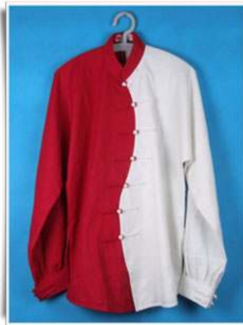
Modèle N°5 "Yin Yang 1" Manche fermée