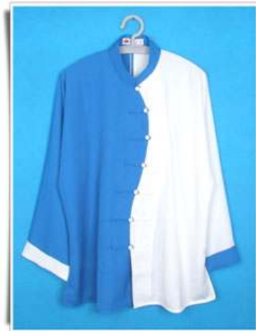
Modèle N°6 "Yin Yang 2" Manche ouverte