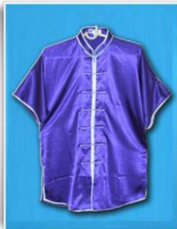
Modèle N°2 "Manche courte"