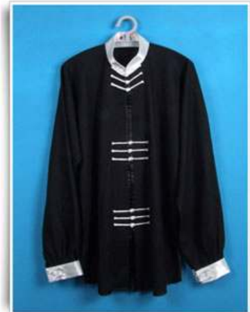
Modèle N°3 "Neuf boutons"